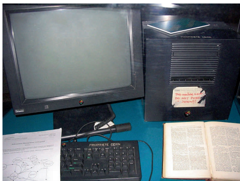
Y cyfrifiadur hanesyddol—gyda nodyn yn dweud wrth bobl am beidio â'i ddiffodd.

Mae Undodiaeth yn llawn gobaith, meddai wedyn, ac mae'r We yn enghraifft o freuddwyd yn