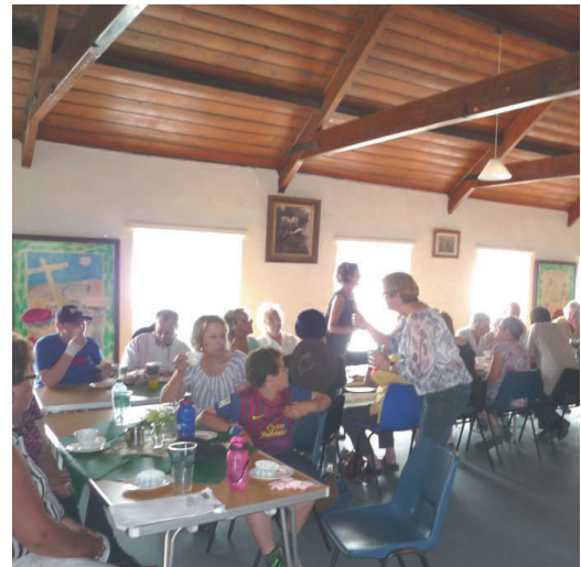
Oddi wrth eu gwaith at eu gwobr!