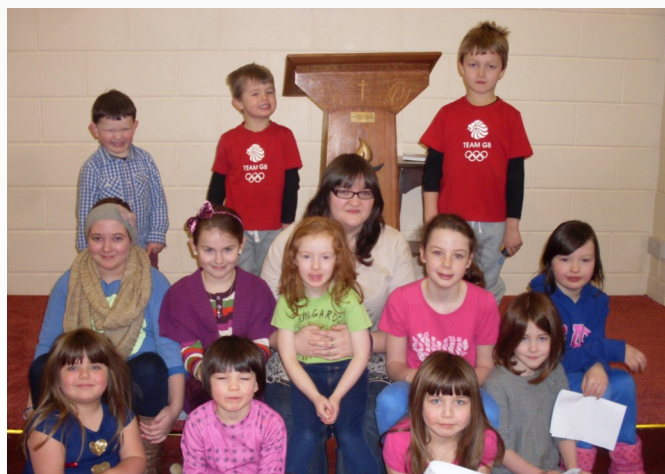
Heini yn ie helpen—gyda'r plant ar fore Sul

Yr ieuentid yw dyfodol yr enwad, nhw sy'n gyfrifol am gadw'r traddodiadau'n fyw ac mae'n bwysig i ni eu cefnogi ymhob ffordd y gallwn.